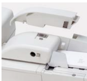
Module de fermeture des enveloppes