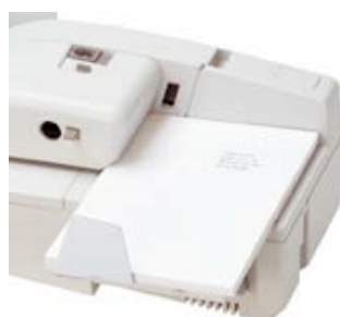
Plateau de chargement grands formats