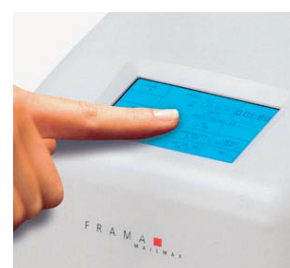
Écran tactile Comtouch™.

Les systèmes Mailmax sont dotés d'un écran tactile de commande . Ni clavier, ni boutons : tout est beaucoup plus simple. En quelques pressions, l'utilisateur accède à l'ensemble des fonctionnalités du système en bénéficiant d'une interface d'une logique évidente. On n'a jamais fait plus simple pour affranchir le courrier.